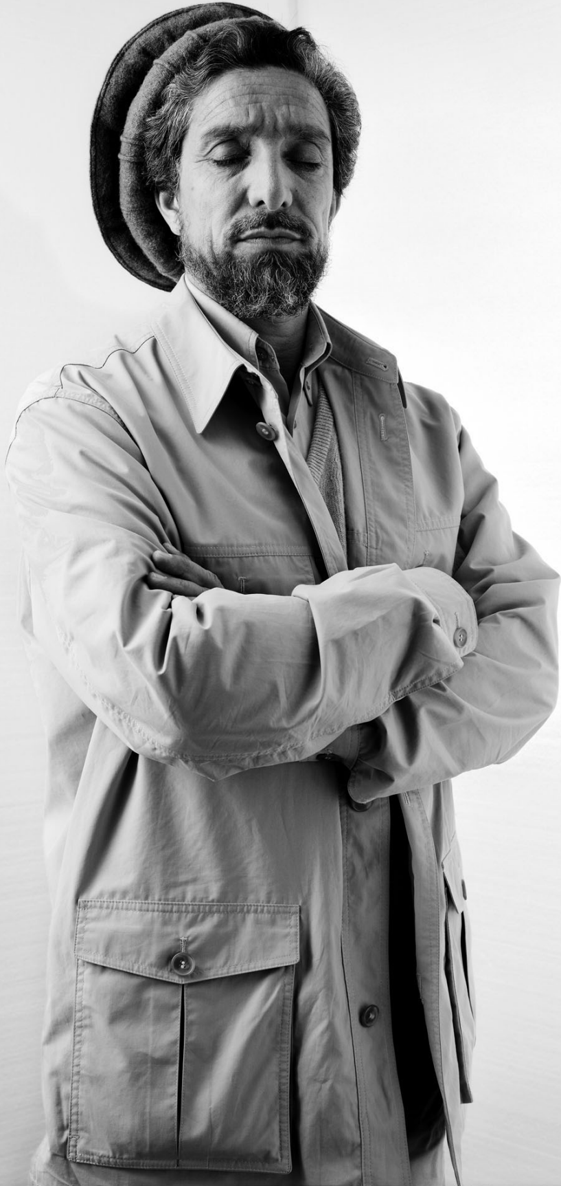
AHMAD SHAH MASSOUD